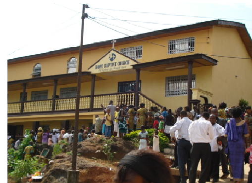
opening van Hope Baptist Church (Freetown)