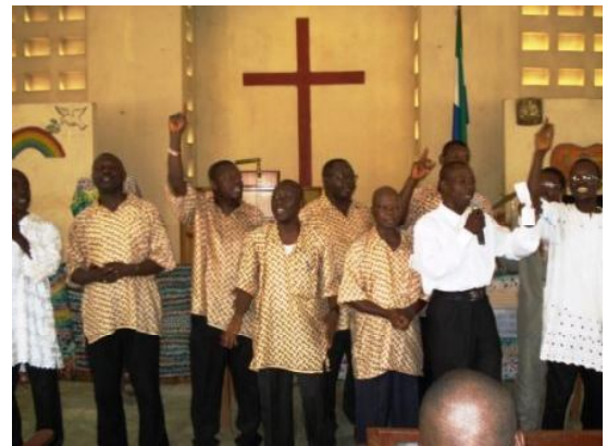
de mannen van Ebenezer (Lunzar) vieren hun jaarlijkse dankdienst